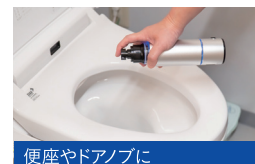
便座やドアノブに