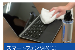
スマートフォンやPCに