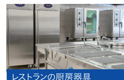
レストランの厨房器具