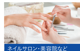
ネイルサロン・美容院など