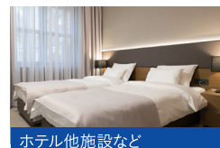
ホテル他施設など

超微細ミストだからムラなく広範囲にスプレー可能。薬剤のストックも不要で、これ1本 でいつでも気になる場所の除菌・消臭が可能です。大掛かりな設備投資もなく、今日か らすぐに衛生対策を始められます。海外5つ星ホテル6社での採用実績もあります。